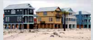
... sandige und weiche Untergründe