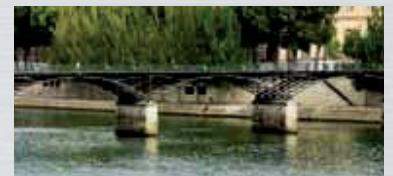
... Uferregionen und Flüsse

... das Einrammen mit herkömmlichen Maschinen