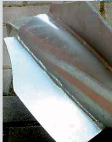
Extrem stabile Flügel!