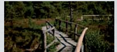
... sumpfige und unebene Gelände